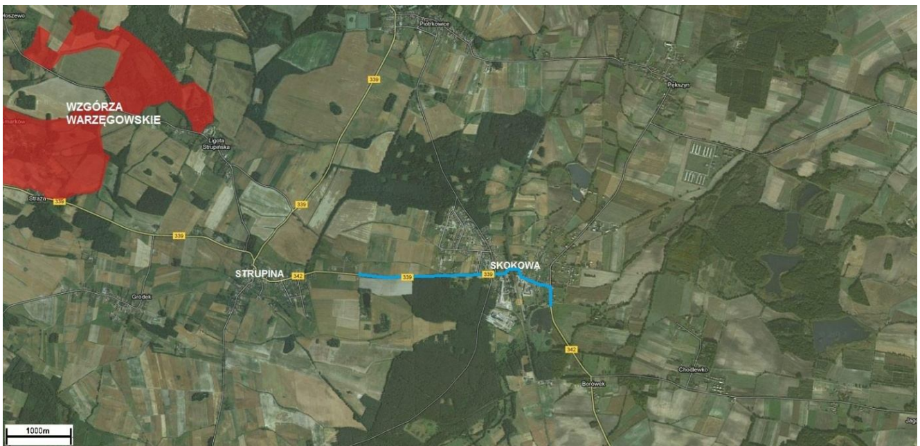
— lokalizacja planowanej inwestycji

Rysunek 1 Usytuowanie przedsięwzięcia względem obszarów przyrodniczo-krajobrazowych prawnie chronionych Wzgórza Warzęgowskie o kodzie obszaru PLH020079 oddalone są o około 3km od planowanej inwestycji.